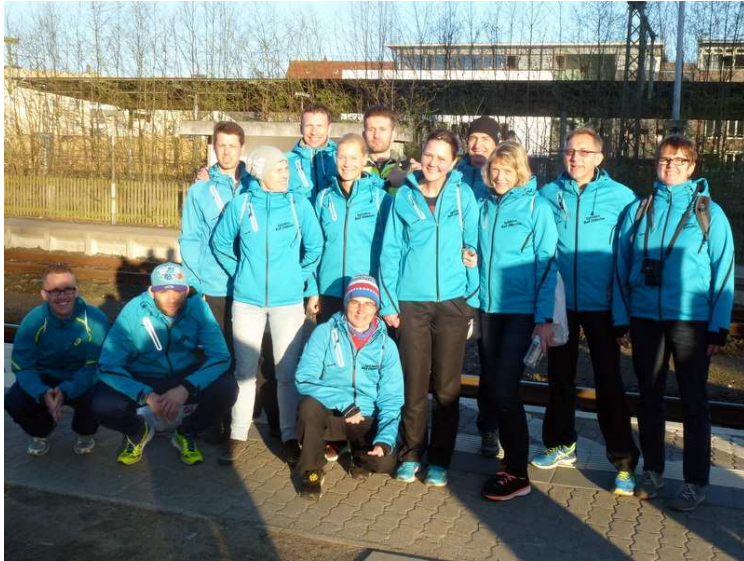
Abfahrt morgens am Oldesloer Bahnhof